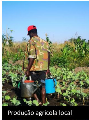
Produção agrícola local