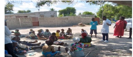
Palestra de sensibilizacao do municípe sobre COVID-19