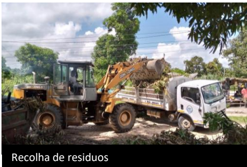
Recolha de resíduos